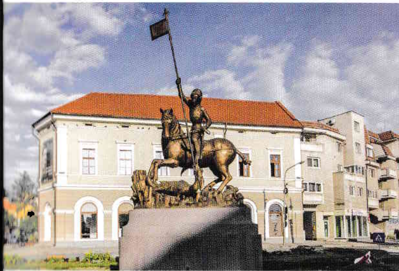
Szent György Szobor, háttérben a Bazar

A Bethlen Gábor és I. Rákóczi György idejében virágzó Erdélyi fejedelemség idején, e kis város is rátért a fejlődés útjára. Jöttek történetében a megpróbáltatás esztendei is: 1658-ban tatárok