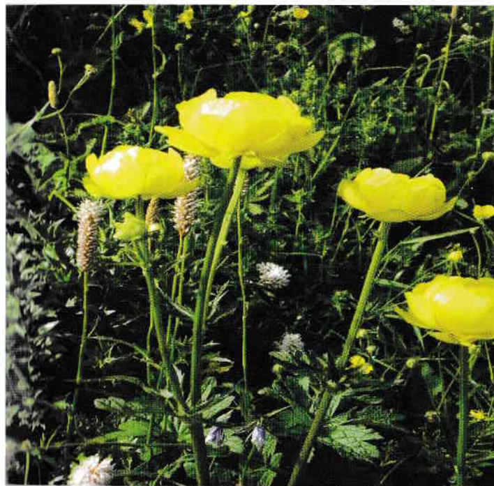
Zsephajlár, Benedekmező, Sepsiszentgyörgy

szélén nagy kiterjedésű mesterséges tó terül el. Ez a Rétyi-tó. Ez is madárszálló és a sporthorgászok paradicsoma. Partjára épült a Tavirózsa motel. Vendégszobákkal és tágas vendéglővel várja a turistákat, kirándulókat (tel.: 0267 373 815). Más szálláshely: Palma panzió, ötterem, tel.: 0743 018 457.